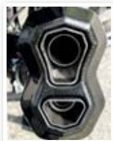
De vorm van de carbon eindkap verklaart meteen de modelnaam.

Het Oostenrijkse Remus biedt meerdere uitlaatsystemen en vervangdempers aan voor de BMW R 1250 GS. De Remus 8 is de nieuwste en hij dankt zijn naam aan de vorm van z'n achteraanzicht. Het materiaal voelt kwalitatief aan, ook de bouwkwaliteit en de pasvorm zijn zeer goed; allemaal zaken die bijdragen aan een eenvoudige montage. Bovendien weegt de Remus 8 maar liefst 1,2 kg minder dan het origineel. Van de zes geteste dempers is de Remus 8 met voorsprong de luidste en knettert hij ook opvallend hard. Op de testbank moet hij (lichtjes) onderdoen voor het origineel; al zal je die twee pk heus niet voelen aangezien het topvermogen langer vastgehouden wordt.