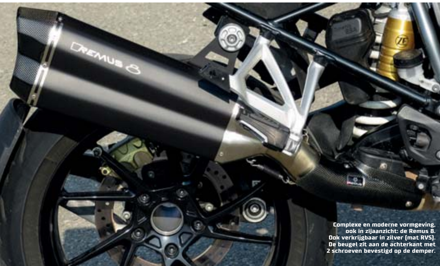
Complexe en moderne vormgeving, ook in zijaanzicht: de Remus 8. Ook verkrijgbaar in zilver (mat RVS). De beugel zit aan de achterkant met 2 schroeven bevestigd op de demper.

max. 134 pk @ 7.400 tpm max. 143 Nm @ 6.100 tpm