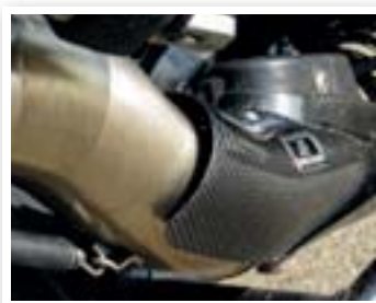
Trekveertjes laten zich makkelijk vastmaken, alle onderdelen passen netjes.