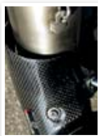
Afdekkap van het verbindingstuk is eveneens carbon.